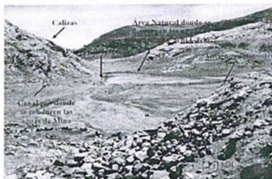
Vista N° 48.- Se aprecia área natural (depresión) donde se descargan e infiltran las aguas del efluente de la bocamina Cachi Cachi, al lado derecho se observan antiguos desmontes que son lixiviados por el agua de lluvia. (Ver recomendaciones adicionales N° 15 y 16).