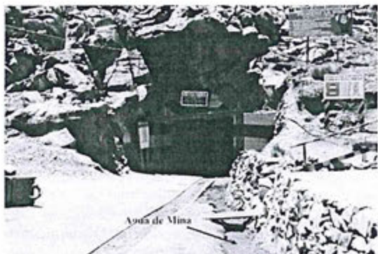
Vista N° 47.- Efluente proveniente de la bocamina Cachi Cachi. Actualmente la bocamina no está en operación, solo se utiliza como acceso.