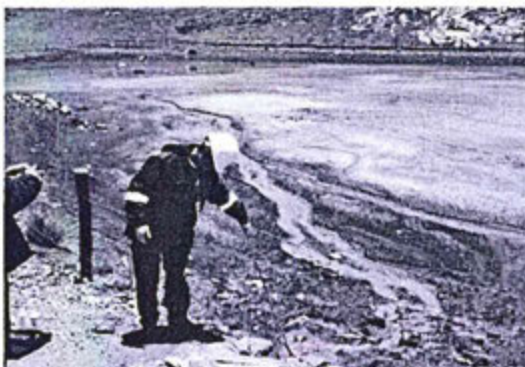
Vista N° 50.- Monitoreo de calidad del agua en punto de descarga del efluente de la bocamina Cachi Cachi. Es una depresión natural y se infiltra a interior mina.

33. Del mismo modo, del Informe de Supervisión se señaló lo siguiente 38 :