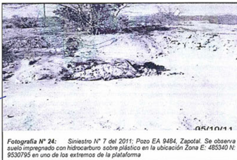
Fotografía N° 24: Siniestro N° 7 del 2011; Pozo EA 9484, Zapotal. Se observa suelo impregnado con hidrocarburo sobre plástico en la ubicación Zona E: 485340 N: 9530795 en uno de los extremos de la plataforma