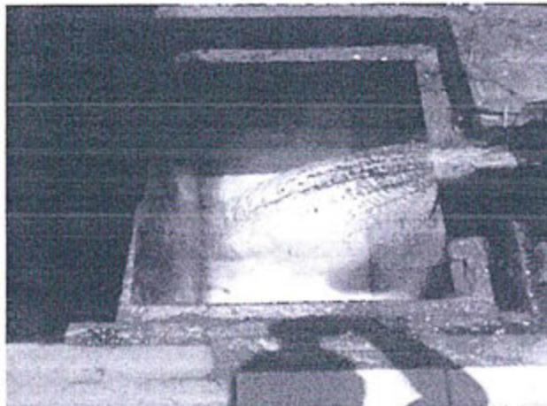
Foto N° 3 Detalle de la caja registro, donde se observa que el sistema de canaletas no cuenta con ningún sistema de recolección de sólidos, los cuales van directamente a la red de alcantarillado.