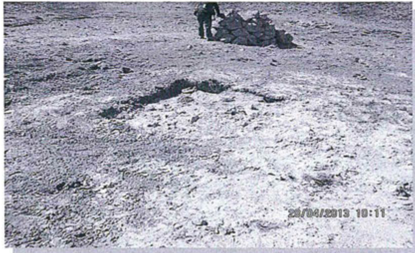
Foto 01: Hallazgo N° 1: En la poza de sedimentación de la plataforma NIL12-01, con coordenadas UTM: 8 388 923N y 403 686E, se observa la falta de nivelación y revegetación.