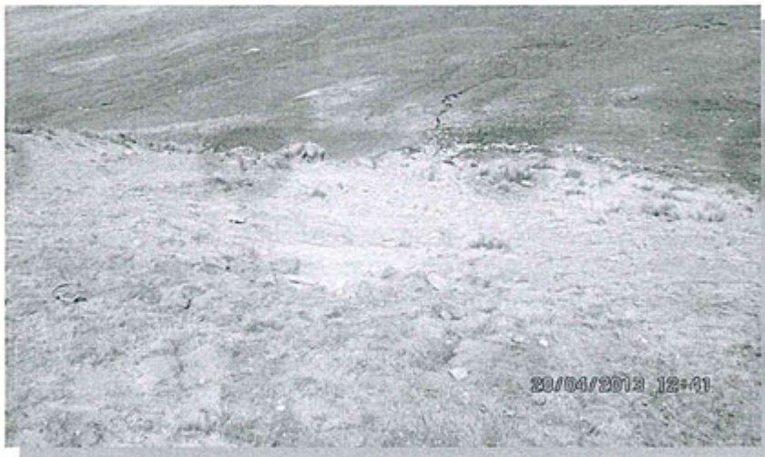
Foto 03: Hallazgo N° 1: En la poza de sedimentación de la plataforma MAR12-05, con coordenadas UTM: 8 386 103N y 404 126E, se observa la falta de nivelación y revegetación.