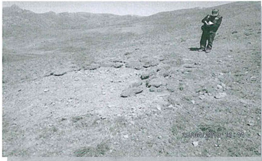
Foto 02: Hallazgo N° 1: En la poza de sedimentación de la plataforma MAR 12-02, con coordenadas UTM: 8 386 769N y 404 286E, se observa la falta de nivelación y revegetación.