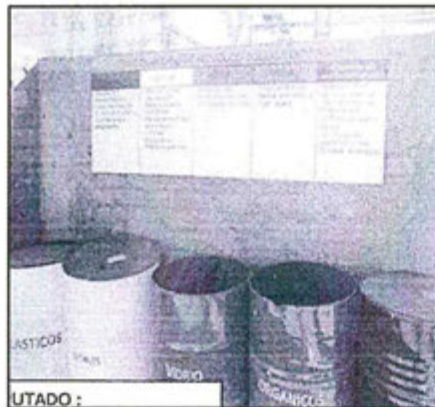
Vistas de la actual Zona de acopio de residuos sólidos generales