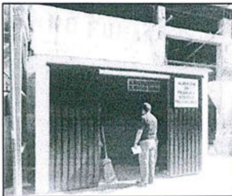
Vista exterior e interior del almacén central para residuos sólidos peligrosos