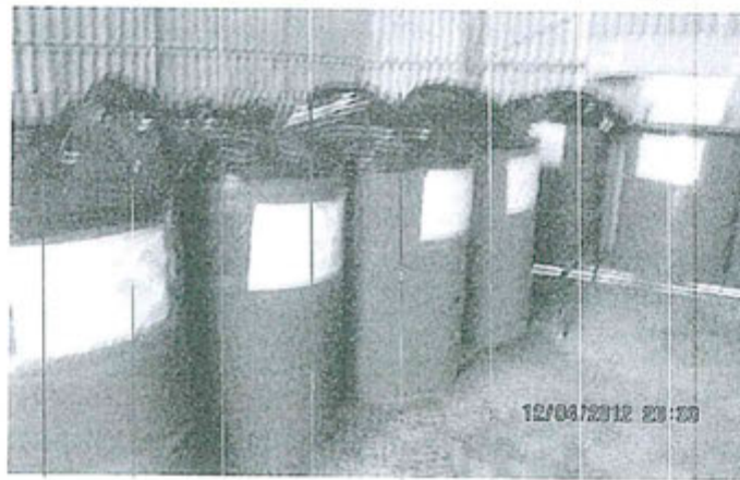
Fotografía N° 4: Vista en el interior de los cilindros de residuos peligrosos sin las correspondientes tapas.