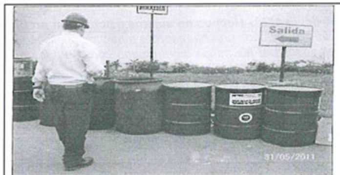
Fotografía N° 10: En la Garita de Salida de los camiones cisternas, junto a los cilindros de residuos no peligrosos, se observaron tres (03) cilindros abiertos con combustibles líquidos, producto de mantenimiento de equipos.

64. Asimismo, de la revisión del Anexo II del Informe de Supervisión, correspondiente al "Registro Fotográfico", se aprecia que las fotografías N° 10 y 11 muestran lo observado por el supervisor 73 :