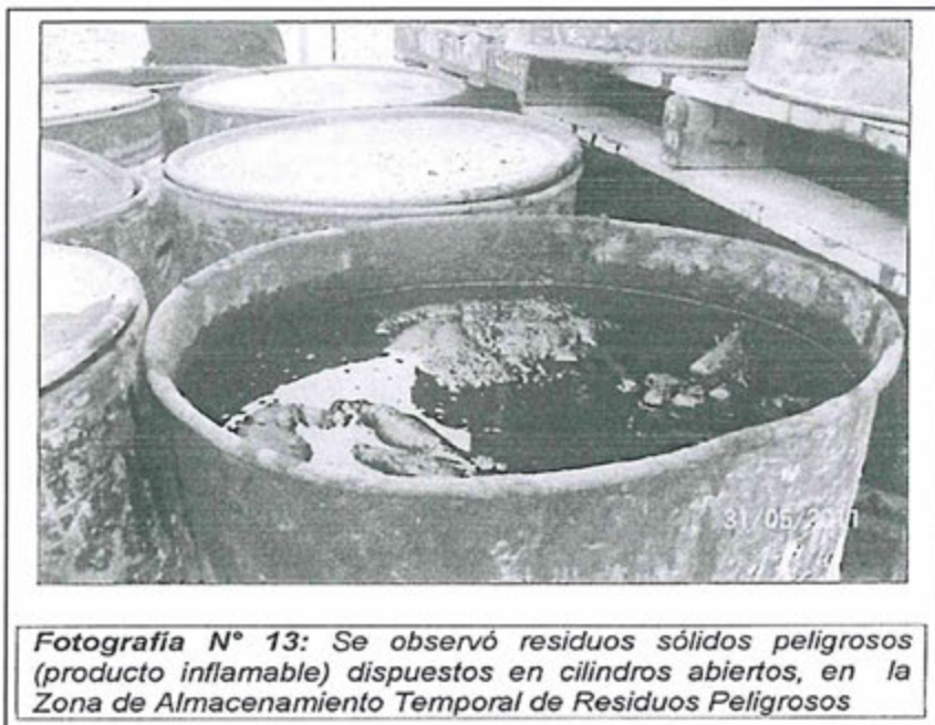
Fotografía N° 13: Se observó residuos sólidos peligrosos (producto inflamable) dispuestos en cilindros abiertos, en la Zona de Almacenamiento Temporal de Residuos Peligrosos