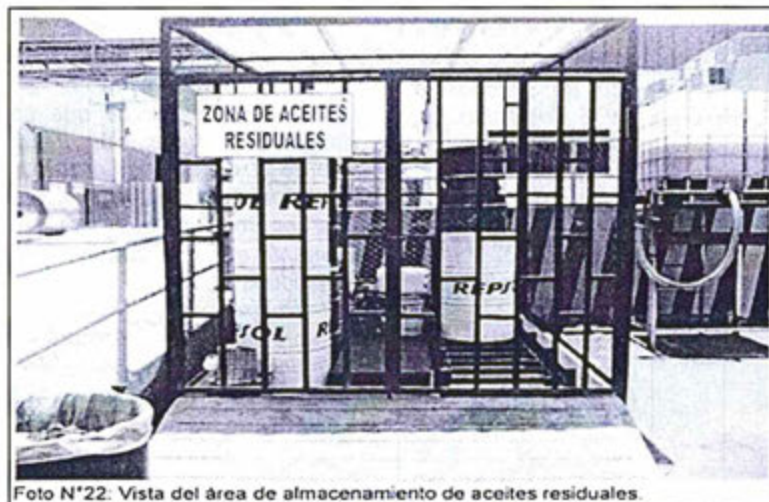
Foto N°22. Vista del área de almacenamiento de aceites residuales.

91. (...) durante la supervisión efectuada el 5 de marzo de 2013, la Dirección de Supervisión constató que Tissue no contaba con un almacén central para el acopio de sus residuos sólidos peligrosos.