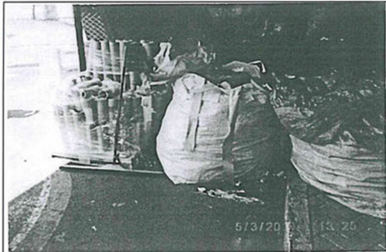
Foto N°39: Vista de almacenamiento de conos de cartón, papel y costales en la primera celda sin la rotulación respectiva.