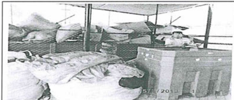
Foto N°41: Vista de parte posterior de la segunda celda de almacenamiento, contenedores azules con bolsa plásticas verdes y cajas de cartón.