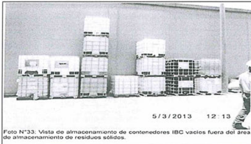
Foto N°33: Vista de almacenamiento de contenedores IBC vacíos fuera del área de almacenamiento de residuos sólidos.