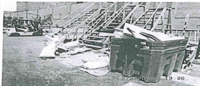
Foto N°42: Almacenamiento de cartones fuera del área de almacenamiento de residuos sólidos no peligrosos y otros residuos sólidos dispuestos al costado de este.

[Handwritten signature] [Handwritten signature]