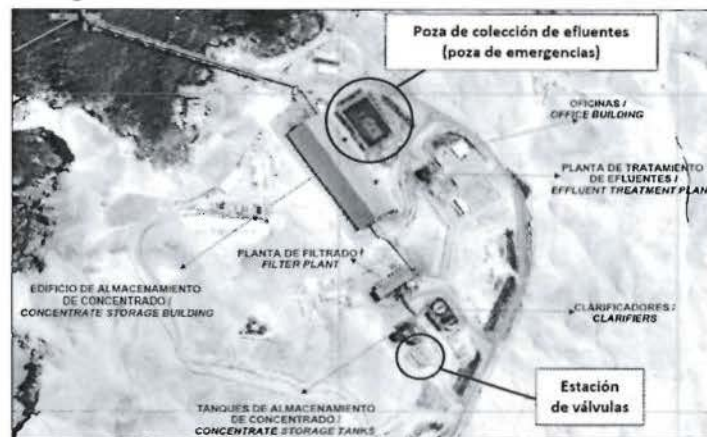
Figura 6-2: Distribución de las Instalaciones del Puerto