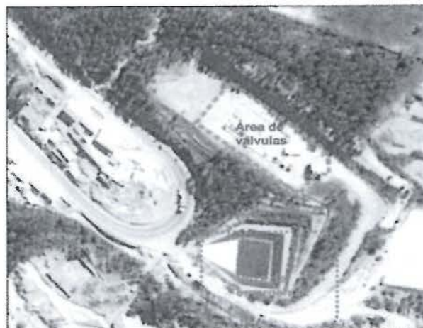
Figura N° 1 –Fotografía aérea Estación de Válvulas VS-1