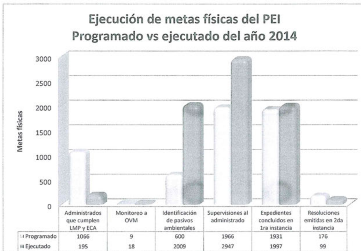
Gráfico N° 1