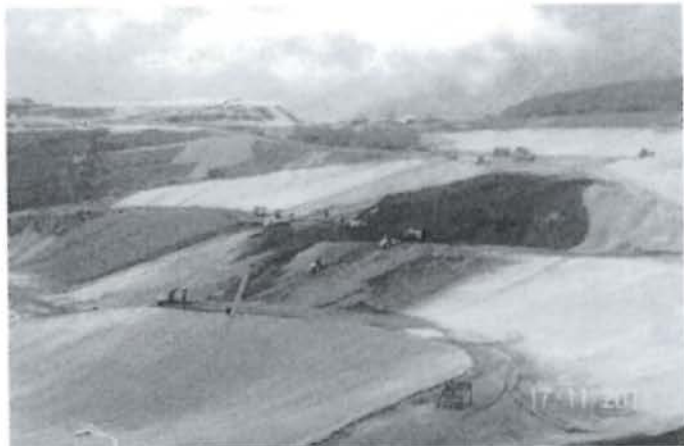
Foto N° 18: Sistema de impermeabilización del pad de lixiviación con geomembranas