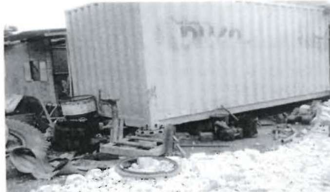
Foto N° 08A: Taller del contratista Dusa, falta segregación de los residuos industriales no peligrosos y peligrosos y los recipientes de aceite usado no cuentan con estanca de seguridad para evitar posibles derrames y/o fugas. Observación N° 7, Supervisión Ambiental 2011.