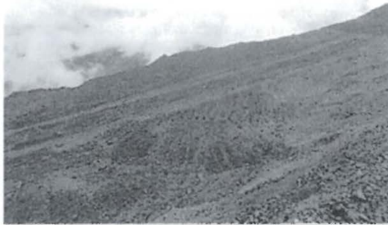
Fotografía N° 2: Se observa la plataforma conformada del piso del Nivel 3850 como mejora al punto en mención se construirá sistema de drenaje.