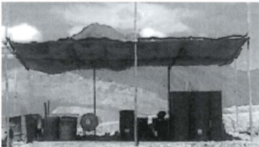
Fotografía N° 3: Se adecuó contenedor de recipientes, para evitar posibles derrames y manejo de adecuado de sus residuos.