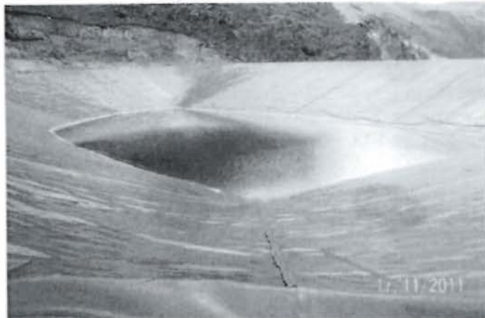
Foto N° 20: Sistema de impermeabilización de la poza de soluciones ricas con geomembranas de HDPE de 1.5 mm.