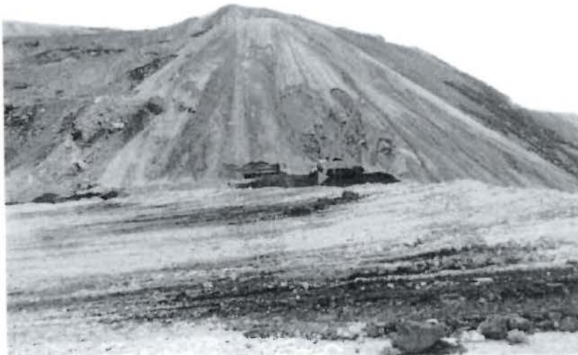
Fotos N° 07: La unidad minera Minas pampa, no cuenta con relleno sanitario, lo entierran en el depósito de desmonte, Observación N° 06 Supervisión Ambiental 2011.