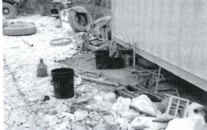
Foto N° 08: Obsérvese el taller del contratista Andean, falta segregación de los residuos industriales no peligrosos y peligrosos. Observación N° 07, Supervisión Ambiental 2011.