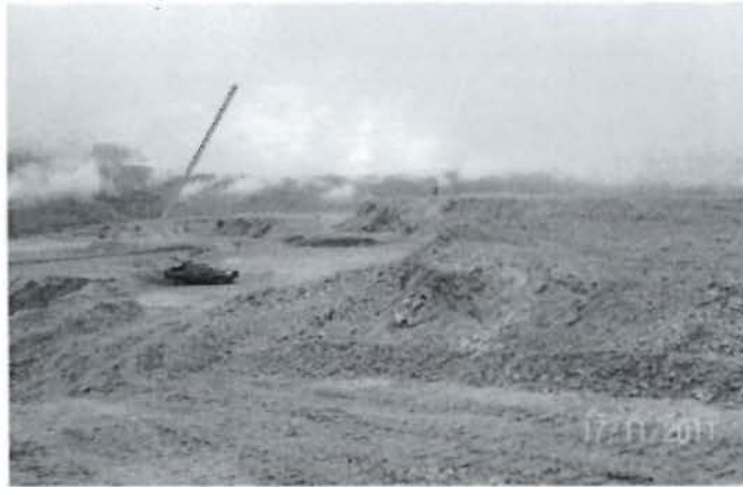
Foto N° 14: Vista del nivel superior del tajo Minaspampa en desbroce, no se constató presencia de aguas de mina.