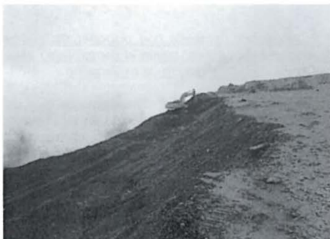
Fotografía N° 1: Se observa el retiro del desmonte acumulado y el perfilado del talud a lo largo del Nivel 3850 retirando el material orgánico para su debido resguardo.