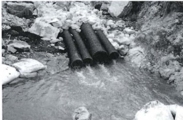
Foto N° 22: Sistema de tuberías para el control y monitoreo de las aguas subterráneas del pad de lixiviación.