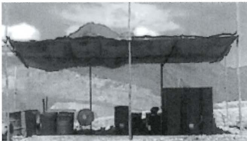
Fotografía N° 3: Se adecuó contenedor de recipientes, para evitar posibles derrames y manejo de adecuado de sus residuos.