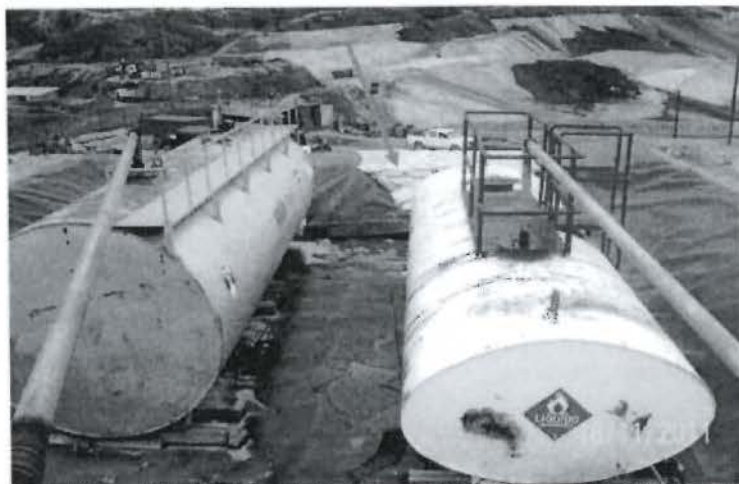
Foto N° 09: Grifo Andean, obsérvese que falta impermeabilización de una parte, para evitar derrames y/o fugas de hidrocarburos. Observación N° 08 Supervisión Ambiental 2011.