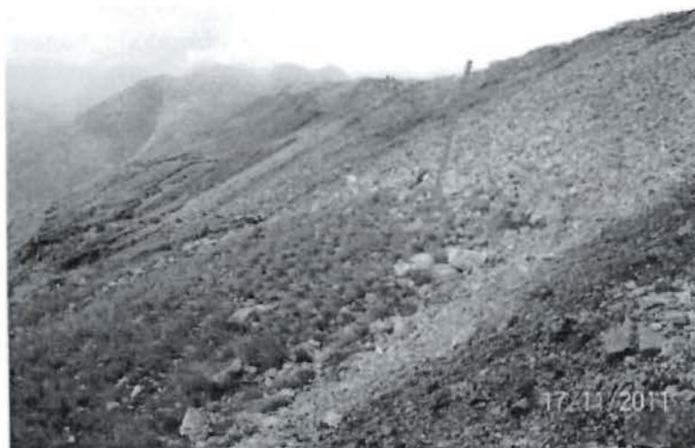
Foto N° 03: Obsérvese el extremo Este del nivel 3850 Tajo Minaspampa, desmonte sobre la vegetación, Observación N° 02, Supervisión Ambiental 2011.