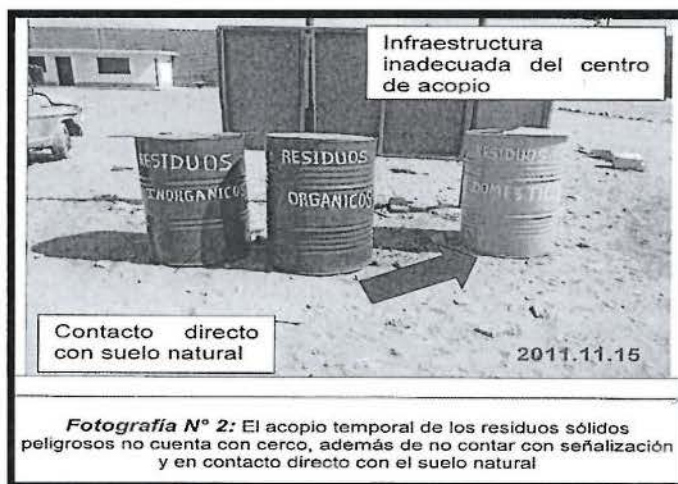
Fotografía N° 1