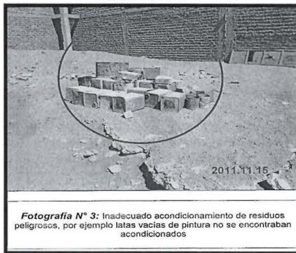
Fotografía N° 2