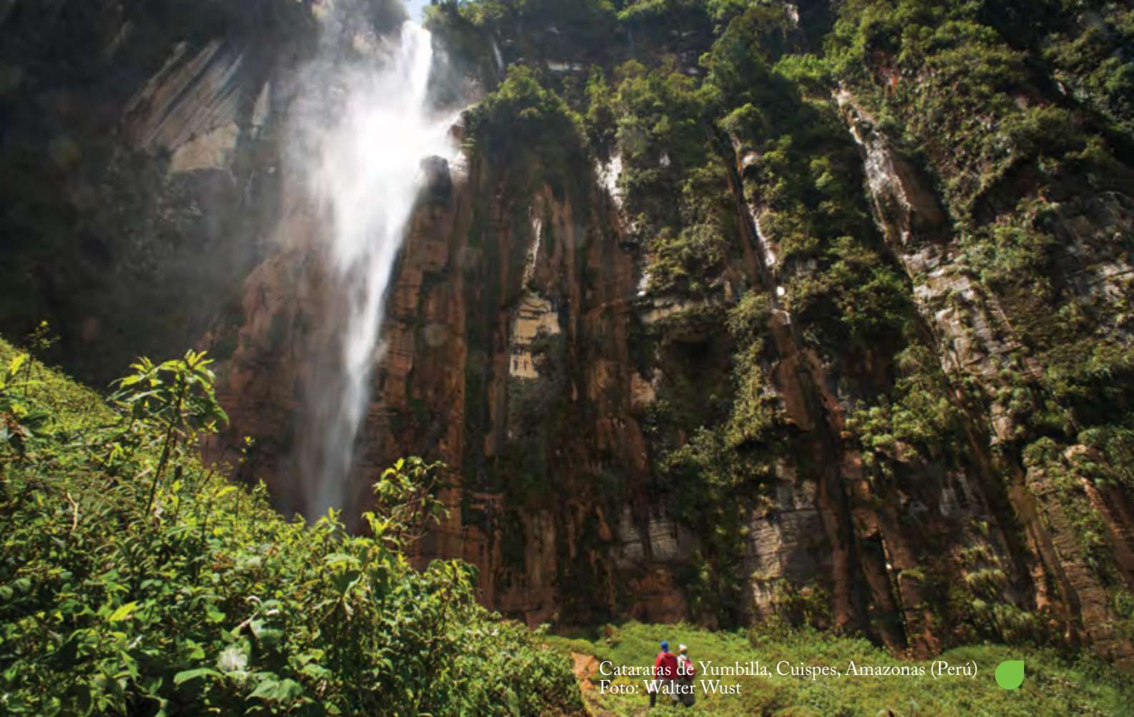
Cataratas de Yumbilla, Cuispes, Amazonas (Perú)

(...) su dimensión negativa se traduce en la obligación del Estado de abstenerse de realizar cualquier tipo de actos [sic] que afecten al medio ambiente equilibrado y adecuado para el desarrollo de la vida y la salud humana. En su dimensión positiva le impone deberes y obligaciones destinadas a conservar el ambiente equilibrado, las cuales se traducen, a su vez, en un haz de posibilidades. Claro está que no solo supone tareas de conservación, sino también de prevención que se afecte [sic] a ese ambiente equilibrado 24 .