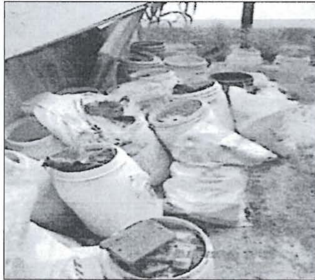
Fotografía N° 17