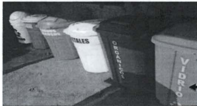
Figura N°2B.- Vista general del interior del almacén central temporal de residuos sólidos

Dispositivo de almacenamiento de residuos sólidos peligrosos y no peligrosos