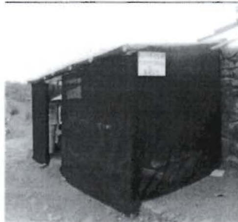
Figura N°2A.- Vista general de almacén temporal de residuos sólidos (peligrosos y no peligrosos)