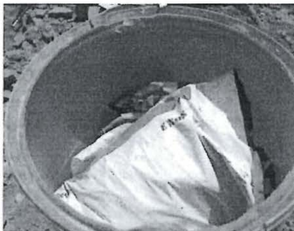
Foto 11. Inadecuada segregación de residuos (facho azul: papel v cartón)