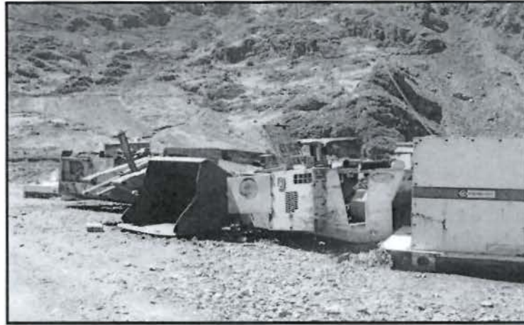
Fotografía N° 10 del Informe de Supervisión: Vista fotográfica donde se muestra que la Recomendación N° 1 de la Supervisión Regular 2009 fue parcialmente cumplida.