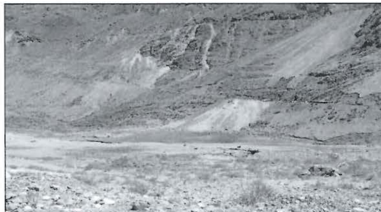
Fotografía N° 13 del Informe de Supervisión: Vista donde se muestra que no se ha construido el muro de contención en el depósito de desmorte.