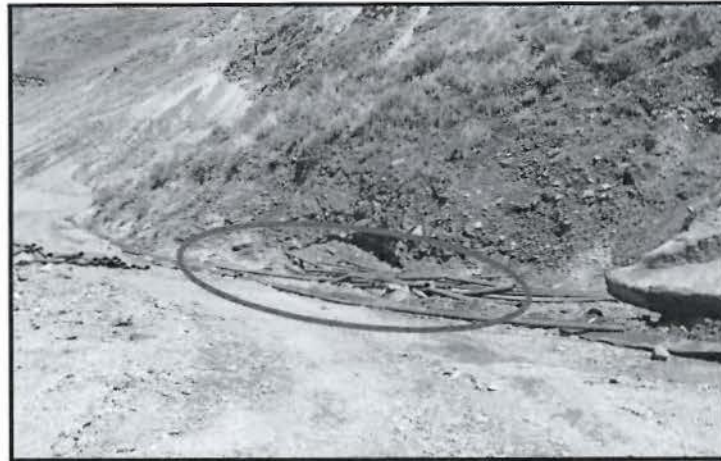
Fotografía N° 11 del Informe de Supervisión: Vista de la Recomendación N° 2 Supervisión 2009, parcialmente cumplida.