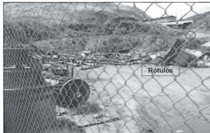
Fotografía N° 27 del Informe de Supervisión: Vista donde se muestra que la Recomendación N° 10 de la Supervisión Regular 2009 fue parcialmente cumplida.