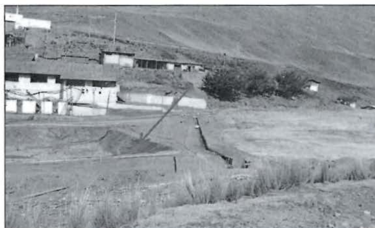
Fotografía N° 23 del Informe de Supervisión: De acuerdo con la Supervisora, la Recomendación N° 8 de la Supervisión Regular 2009 fue cumplida de manera parcial.