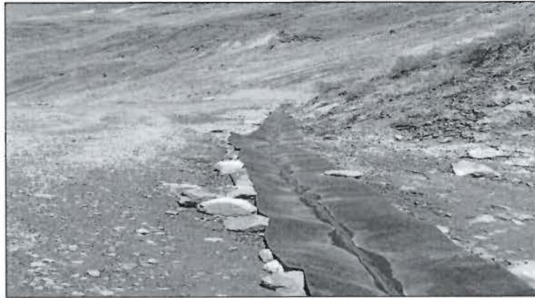
Fotografía N° 12 del Informe de Supervisión: Vista donde se muestra que Pachapaqui implementó un canal para las aguas de escorrentía.