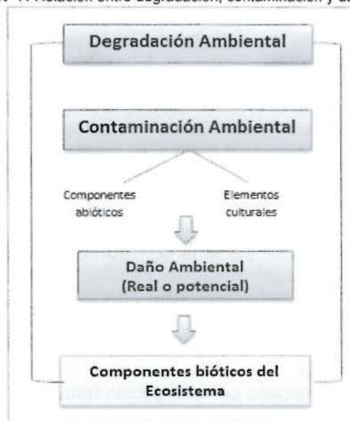
Gráfico N° :1 Relación entre degradación, contaminación y daño ambiental