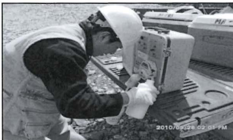
"FOTO N° 48: Filtración en campo del Punto de Control Especial ESP-02 (Punto adicional efluente agua de los sub-drenes de la presa de relaves "Oasis"), realizado por personal de Laboratorio J. Ramón".