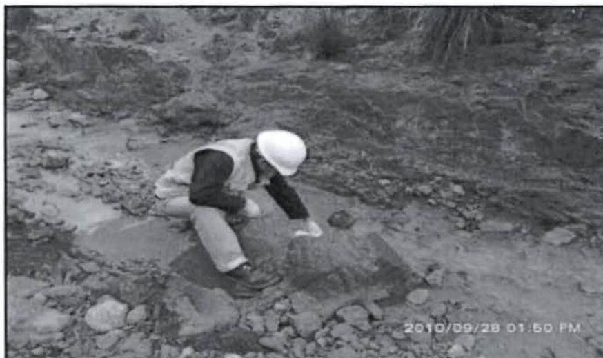
"FOTO N° 47: Monitoreo del Punto de Control Especial ESP-02 (Punto adicional efluente agua de los sub-drenes de la presa de relaves "Oasis"), realizado por personal de Laboratorio J. Ramón".