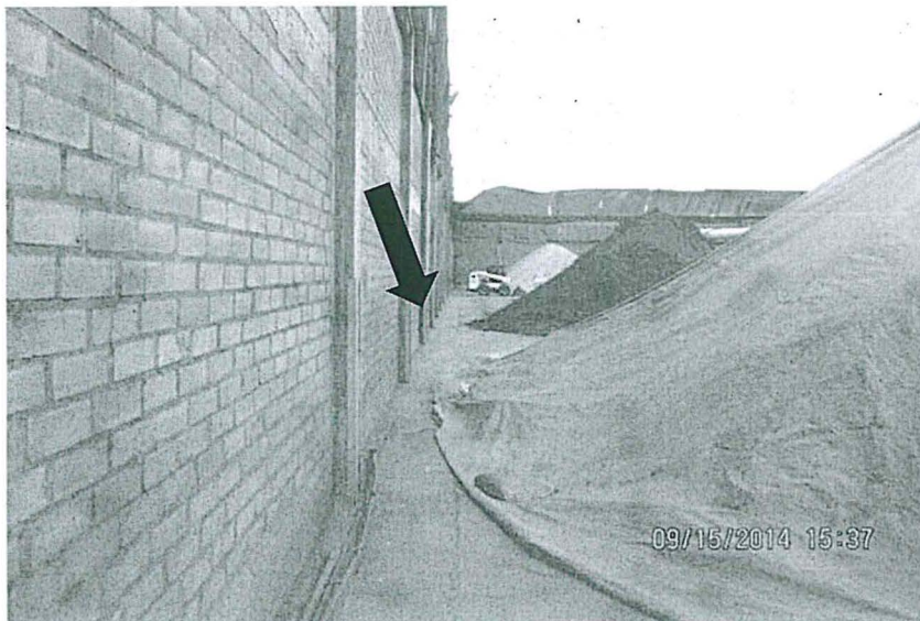
Fotografía de la Carta N° IP-GG-252/14 presentada por Impala