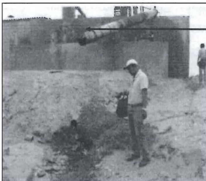
Vista fotográfica tomada desde el medio marino Tubo de PVC por donde salen los efluentes