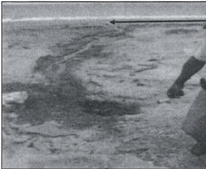
Vista fotográfica tomada desde la planta de curado Los efluentes van con dirección al medio marino.

45. Así, del Reporte de Ocurrencias N° SECHURA-01-01-2012-PRODUCE/DIGSECOVI-Dif y el Informe N° 01-01-2012-PRODUCE/DIGSECOVI-DIF-Sechura, la DIGSECOVI verificó lo siguiente: