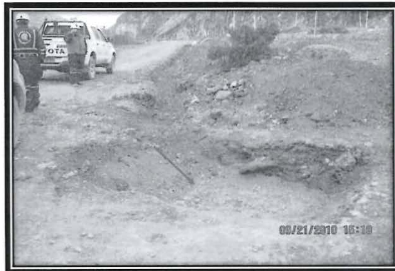
Foto No.31.- Falta completar el sistema de captación de lixiviados del relleno sanitario.