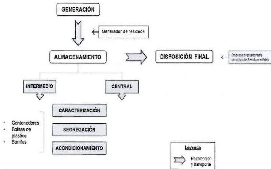
Gráfico N° 1. Etapas del manejo de residuos sólidos