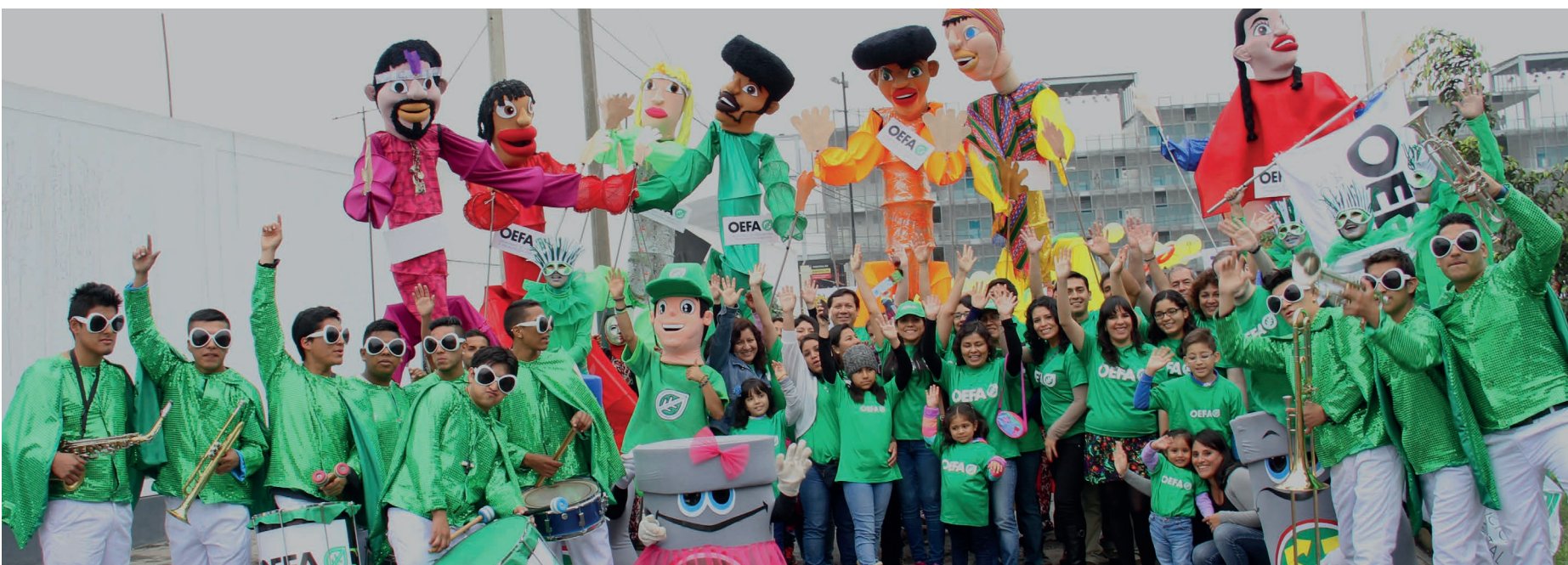
En Lima, el equipo OEFA participó en el pasacalle DIADESOL 2014. "Pon de tu parte y segrega tus residuos".