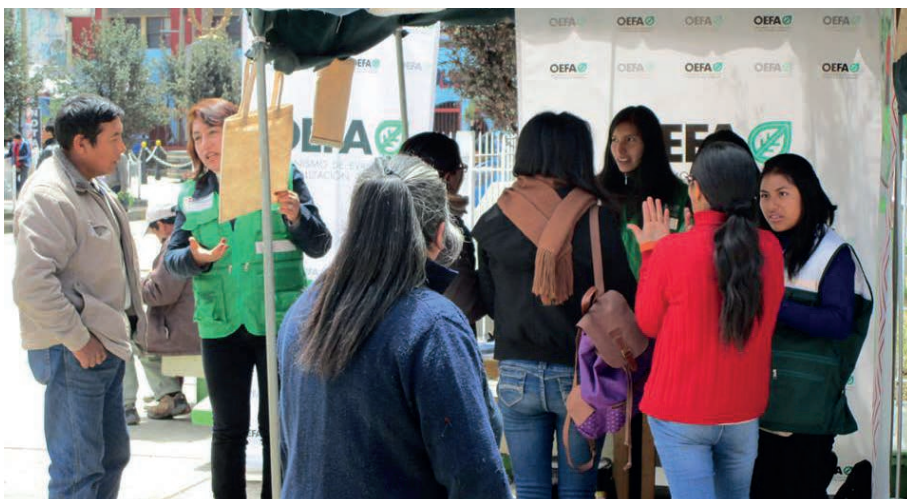
Personal de la institución informa a los ciudadanos de Cerro de Pasco en la plaza Daniel Alcides Carrión.