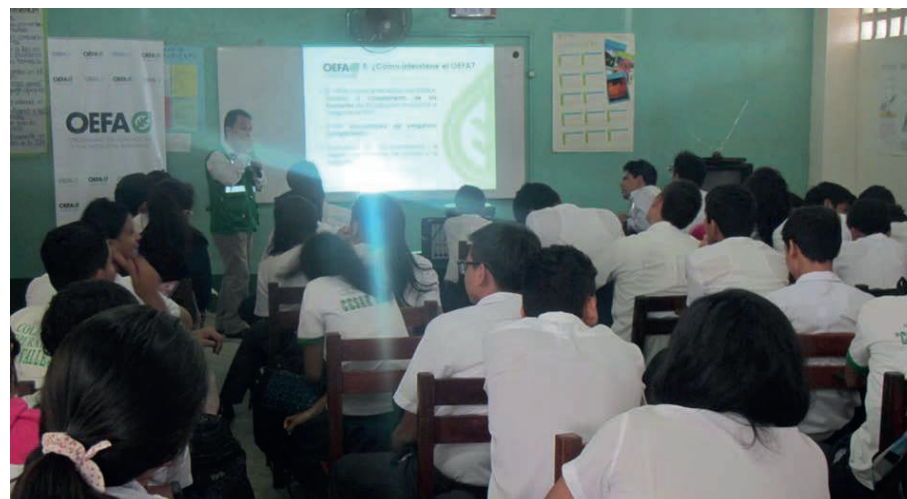
Alumnos del colegio cooperativo César Vallejo de Lambayeque, participaron en charla informativa.