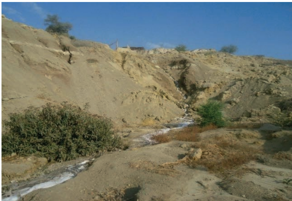
El traslado de los efluentes por el acantilado origina la erosión de las laderas