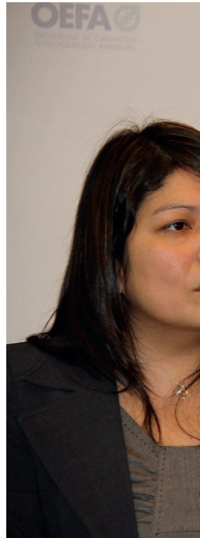
La secretaria general del OEFA, Luz C., comunicó el sustento legal del Aporte por Regulación a la institución.

La decisión de la Sexta Sala Civil de la Corte Superior de Justicia de Lima se encuentra publicada en la página web del Poder Judicial y puede ser descargada a través del servicio de Consulta de Expedientes Judiciales del Poder Judicial en http://cej.pj.gob.pe/cej/forms/busquedaform.html bajo el número de expediente 00220-2014-0-1801-SP-CI-06.