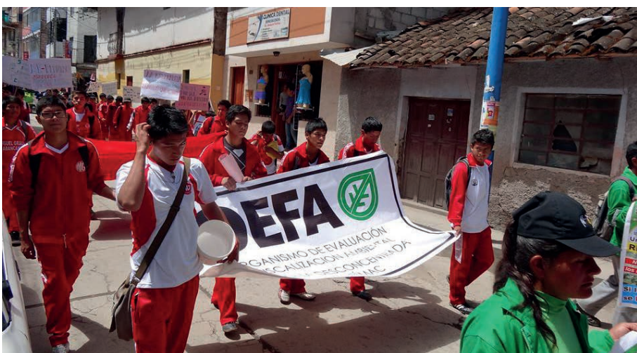
Escolares del departamento e instituciones del Estado, de Apurímac, participaron en un vistoso pasacalle.