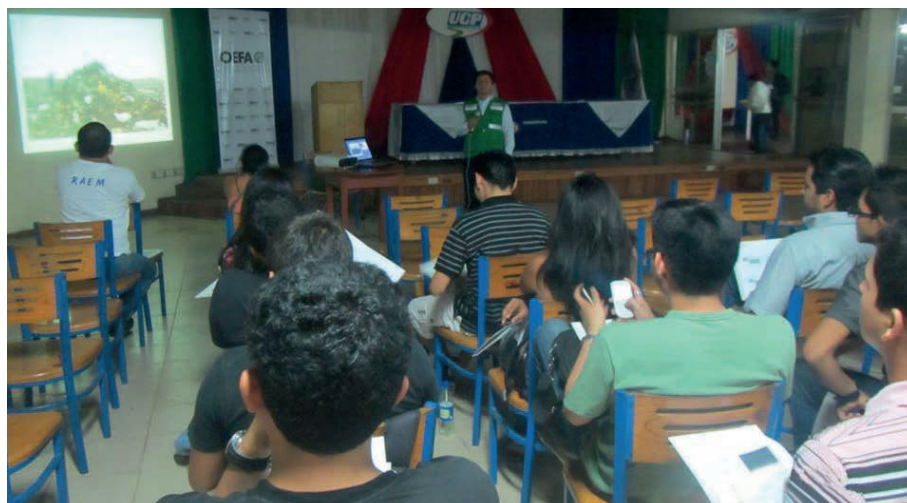
En Iquitos la población participó en Seminario "El nuevo enfoque de la fiscalización ambiental en el Perú"