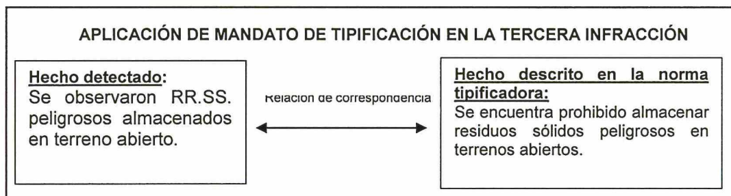
Gráfico N° 2: Análisis del cumplimiento del mandato de tipificación en relación a la tercera infracción