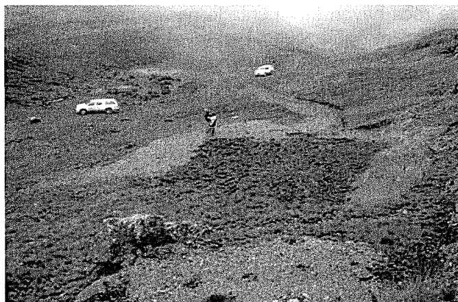
Fotografía N° 06. Observación 02: Silo relleno con desmonte, sin contar con la capa de 15 cm de material orgánica y sin revegetación.