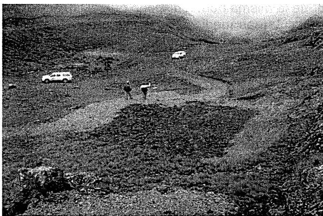
Fotografía N° 03. Observación 01: Acceso y plataforma de perforación "A", sin haberse cumplido con el plan de cierre, al no restituirse el área disturbada a la topografía original de terreno. Faltando rellenar, perfilar el talud, completar la capa orgánica y revegetar la zona.