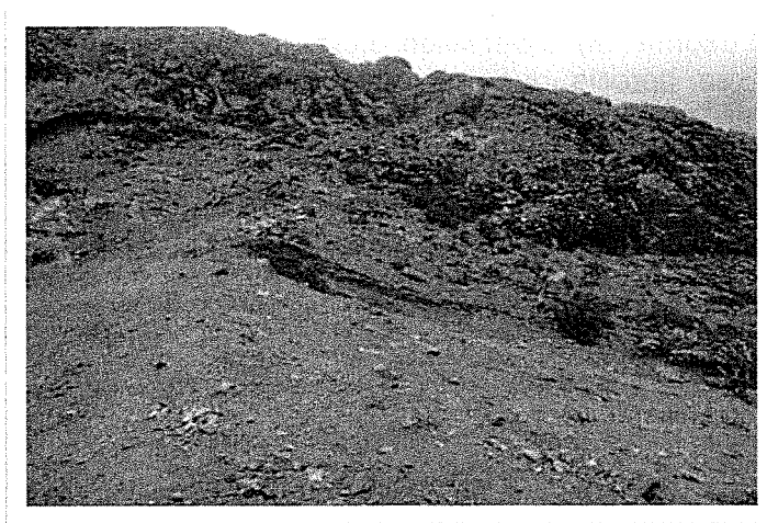
Fotografía N° 07. Observación 03: Último tramo de acceso a la zona de exploración Pucajirca, el talud se encuentra erosionado por las aguas de escorrentía y no cuenta con canales de derivación.