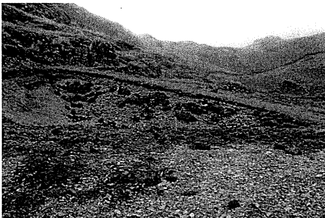
Fotografía N° 04. Observación 01: Plataforma de perforación "A", sin haberse concluido con la remediación total. Obsérvese el piso con material de desmonte, esparcido en parte con una capa delgada de top soil.