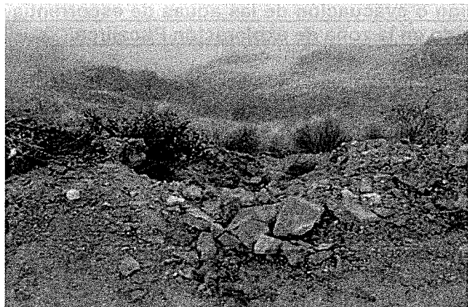
Fotografía N° 08. Observación 03: Erosión del talud en otro punto del tramo final del acceso a la zona de exploración Pucajirca