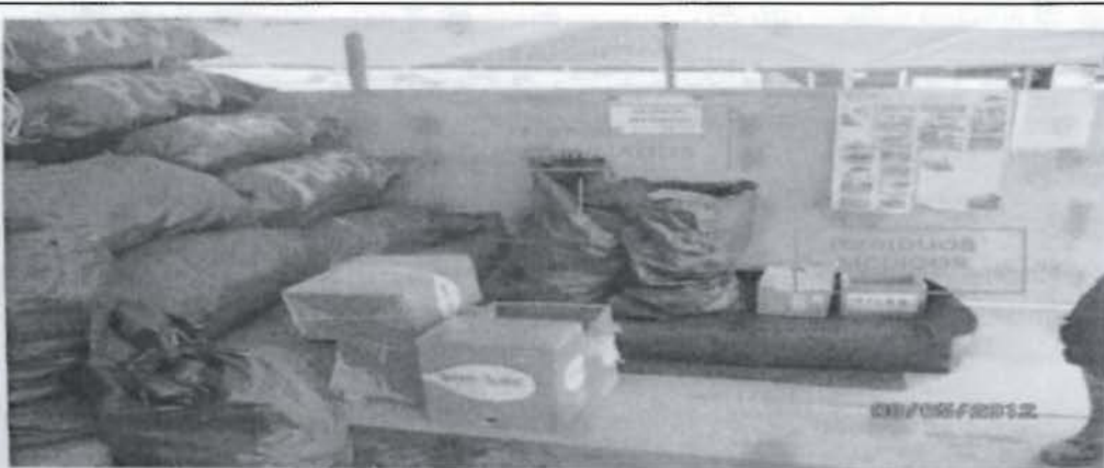
Fotografía N° 3: El área de residuos sólidos peligrosos del almacén de residuos sólidos, contiene bolsas plásticas que almacenan trapos contaminados y residuos médicos.