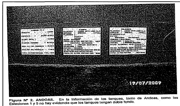
Figura N° 2. ANDOAS. En la Información de los tanques, tanto de Andoas, como las Estaciones 1 y 5 no hay evidencia que los tanques tengan doble fondo.

28. Con relación a la infracción señalada, corresponde indicar que, a través de la Resolución Directoral N° 418-2013-OEFA/DFSAI, esta Dirección sancionó a la empresa Petroperú por el incumplimiento del literal b) del artículo 43° del RPPAH, debido a que se acreditó la responsabilidad de la citada empresa al verificar que el