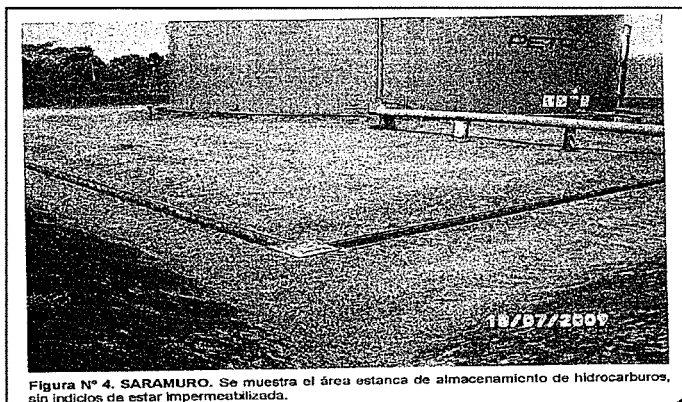
Figura N° 4. SARAMURO. Se muestra el área estanca de almacenamiento de hidrocarburos, sin indicios de estar impermeabilizada.