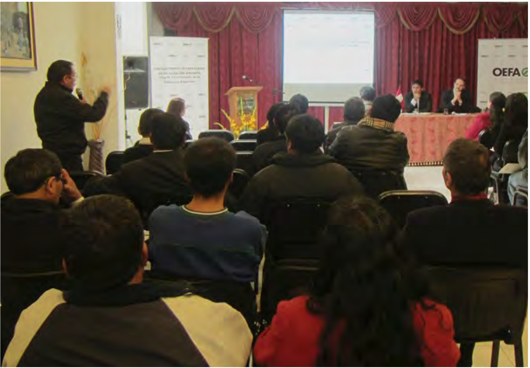
Tercer taller macrorregional en Puno, realizado en mayo del 2014

se supervisa que dichas entidades ejecuten acciones de fiscalización, con énfasis en la pequeña minería y minería artesanal, actividades de producción y salud ambiental. Por otro lado, se formulan recomendaciones y disposiciones de obligatorio cumplimiento, cuya aplicación es verificada. Los prin-