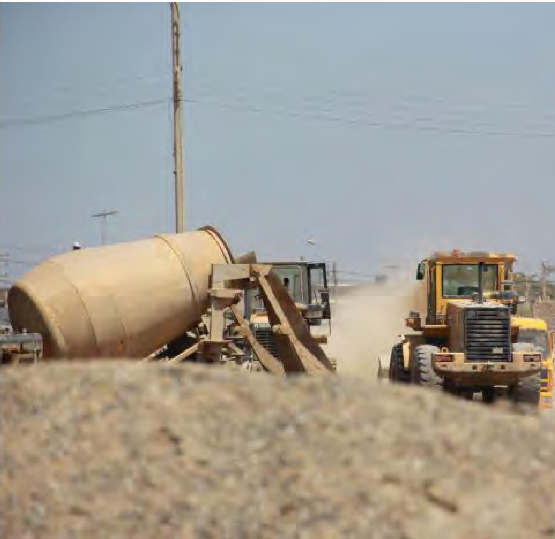
Petros & Concretos S.R.L. realizaba operaciones de minería no metálica ilegal en Chiclayo.