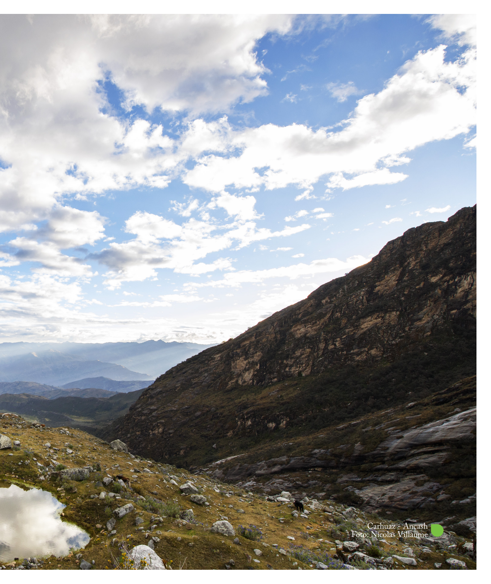
Carhuaz - Ancash